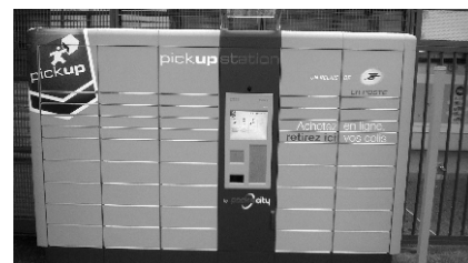
Bureau de Poste du futur ?

Aujourd'hui, à Paris 96% des habitants se situent à moins de 500 mètres d'un bureau de poste. Il faut assurer et garantir l'existence de ce réseau en réimplantant des bureaux dans les nouveaux quartiers de la ville ( Bibliothèque dans le 13 ème , Bercy dans le 12 ème , Batignolles dans le 17 ème , ex entrepôts Mc Donald dans le 19 ème ... ). Ce réseau de bureaux de poste qui assurent différents services est un atout considérable pour développer l'activité économique de La Poste et de l'ensemble des acteurs économiques de la capitale. Vouloir s'en débarrasser, c'est littéralement se tirer une balle dans le pied.